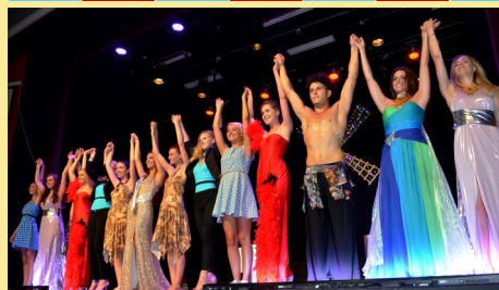
Un magnifique spectacle des Miss Franche-Comté