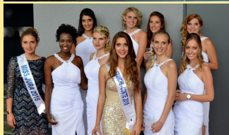
Les 8 candidates avec Miss Jura et Miss Franche-Comté 2016