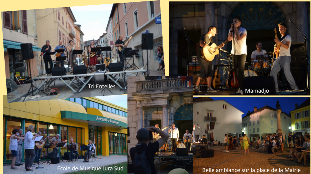
La Fête de la Musique a rassemblé des musiciens de tous horizons, pour notre plus grand bonheur