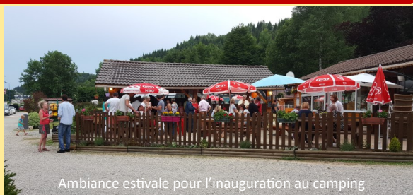
Ambiance estivale pour l'inauguration au camping

C'est dans une ambiance conviviale que les invités ont visité les chalets, les bungalows, la piscine couverte, etc. avant de se réunir autour d'un appétissant buffet pour partager le verre de l'amitié.