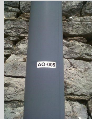
Exemple de référencement d'éclairage public par le SIDEC

Ainsi, si vous constatez une anomalie de fonctionnement sur un éclairage public, il vous suffit de relever la référence et de nous la communiquer par téléphone ou par mail en nous indiquant le type de panne (clignotement, extinction, poteau accidenté, ...). Grâce à ces informations, nos services effectueront un signalement via la plate-forme internet dédiée pour demander une intervention au prestataire, l'entreprise SCEB de Saint-Claude, qui interviendra selon le degré d'urgence de la situation, au plus tard 15 jours après la demande de dépannage.